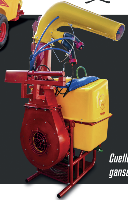
Cuello de ganso